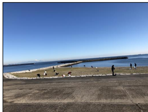
(2018 観光地美化キャンペーン)